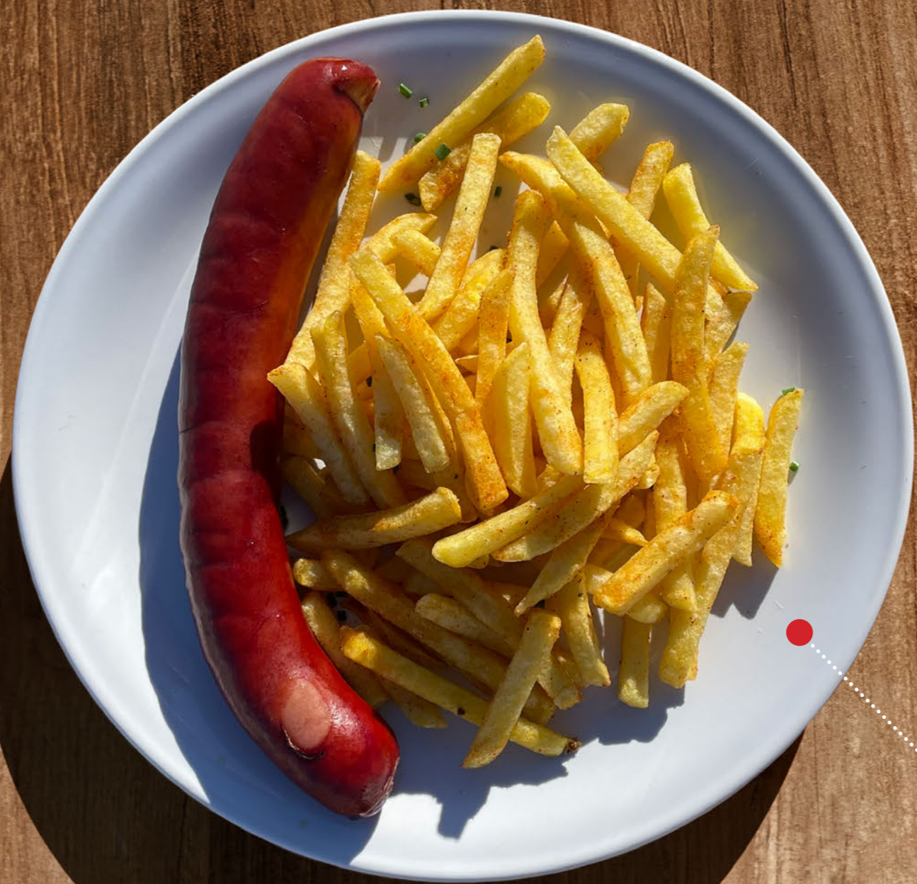
Schübli mit Pommes